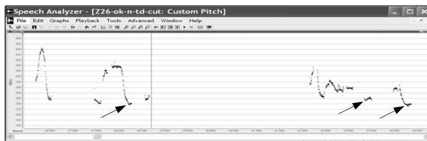
Рис. 2. Тонограмма, соответствующая примеру (15).

Таким образом, решение о выборе между запятой с падением и точкой принимается при транскрибировании устного дискурса на системных просодических основаниях. Необходимо изучить просодическую систему говорящего и понять, как именно у него реализуется семиотическая оппозиция между двумя этими прототипами. Некоторые говорящие очень четко различают два семиотически противопоставленных уровня по критерию А. Другие же не столь явно различают два уровня, но демонстрируют хорошее различие по критерию Б. Для понимания просодической системы прочих говорящих приходится привлекать дальнейшие критерии. Если основные черты просодического «портрета» говорящего поняты, то различить точку и запятую с падением удастся с достаточной степенью надежности.